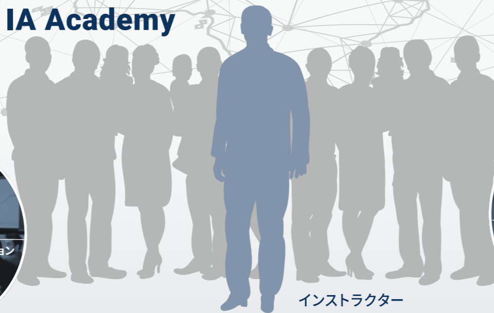
インストラクター