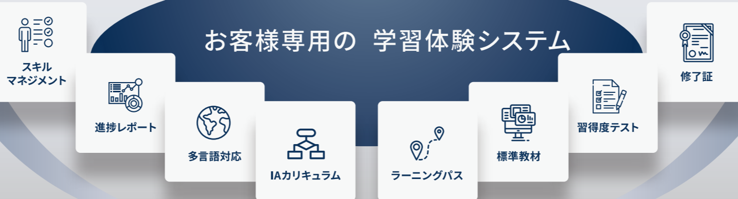
トータルオーガナイザー